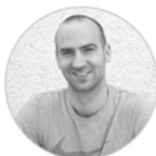
Pädagogische Hochschule St.Gallen Johannes Hensinger Seminarstrasse 27 9400 Rorschach

info@bewegunglesen.ch Tel. +41 71 911 30 64